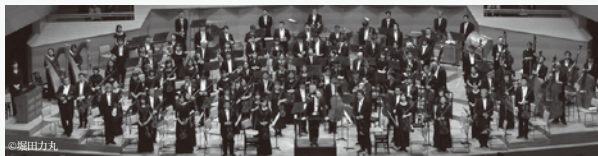
日本フィルハーモニー交響楽団 Japan Philharmonic Orchestra

イベント託児@マザーズ: TEL: 0120-788-222(平日10~12時・13~17時) 0歳児は保育者一対一など、安心の体制が充実したコンサート託児サービス。申込可能人数に限りあり。公演の1週間前まで受付、定員になり次第締切。事前に託児の空き状況をご確認の上、コンサートチケットをご購入ください。 http://www.mothers-inc.co.jp/