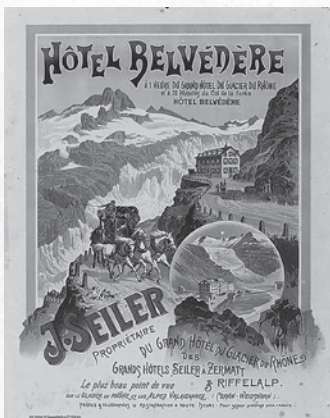
アルプスの名所の1つツェルマットに建てられたホテルの絵葉書。1912年頃。

ここに「アルプス」は大きく変容を遂げ、現在に至るアルプスの在り方が定着していった。