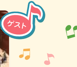
南相馬市立原町第一中学校吹奏楽部