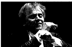
指揮 アレクサンドル・ラザレフ

チャイコフスキー唯一のチェロ協奏曲《ロココ風の主題による変奏曲》には品格あるパフォーマンスの中に豊かな情緒をたたえたチェロの横坂源を迎えます。ラザレフとの1年半ぶりの共演にも期待が高まります。