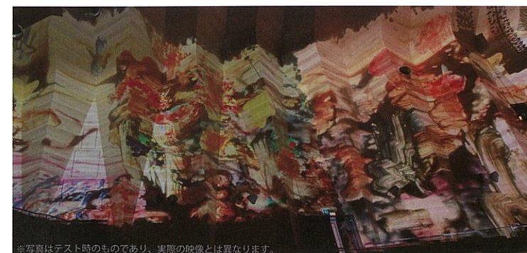
※写真はテスト時のものであり、実際の映像とは異なります。

サントリーホールの壁一面に映し出される映像。 オーケストラとともに新しい空間芸術へ。