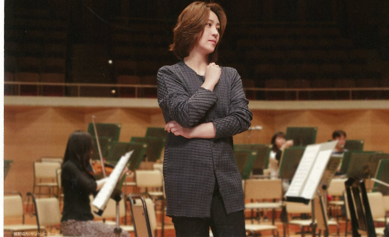
撮影協力: サントリーホール

【お問い合わせ】 日本フィル・サービスセンター TEL 03-5378-5911 (平日 10時~17時)