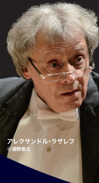
アレクサンドル・ラザレフ