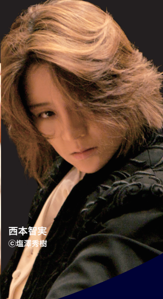
西本智実