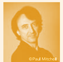
ピانو： ジャン＝エフラム・バヴゼ