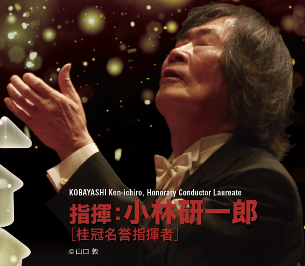
KOBAYASHI Ken-ichiro, Honorary Conductor Laureate