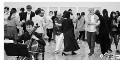
PHOTO 4 4月29日 オケのテイキはおもしろい 日本フィルコミュニケーションディレクターのマイケル・スペンサーによるワークショップ、オケのテイキはおもしろいを開催。定期演奏会で取り上げる作品を様々なアプロウチで紐解くこのワークショップ、今回のテーマは「マーラー:交響曲第9番」。楽員による演奏ありの新しい音楽の楽しみ方をお届けしました。(後日レポートをホームページ等でアップいたします)