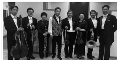
PHOTO 3 4月27日 横浜定期演奏会、28日芸劇シリーズ* 横山幸雄マエストロが紡ぐショパンのピアノとオーケストラをお楽しみいただきました。この弾き振りシリーズ、第2弾は来年の横浜定期演奏会で予定されています。 28日公演終了後、みんなで記念撮影!