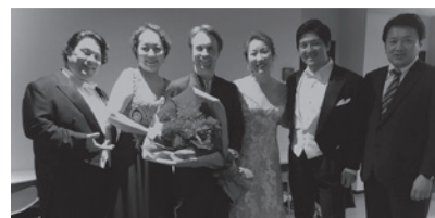
PHOTO 3 インキネン首席最後の演奏会となった「横浜定期演奏会」と「名曲コンサート」は、ベートーヴェンの第九!ソリストの皆様と横浜定期演奏会終演後に記念撮影。そして名曲コンサート終演後のフェアウェル・パーティでのお写真もどうぞ。初共演から15年。たくさんの思い出が蘇ってきます。キートス!マエストロ・インキネン!*