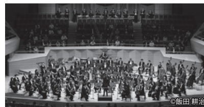
PHOTO 1 9月に首席指揮者に就任するカーチュン・ウォンとの東京定期演奏会。ミヤスコフスキーの交響曲第21番、芥川也寸志の《コンチェルト・オスティナート》(チェロ:佐藤晴真)、ヤナーチェクのシンフォニエッタという意欲的なプログラムをお届けしました。パンダがずらりと並ぶシンフォニエッタの写真をどうぞ!*

楽器編成: 独唱ソプラノ1、独唱テノール2、独唱バリトン2、合唱、児童合唱、フルート3(ピッコロ持替1)、オーボエ2、イングリッシュ・ホルン1、クラリネット2、バス・クラリネット1、ファゴット3、ホルン4、トランペット4、トロンボーン2、バス・トロンボーン1、チューバ1、ティンパニ、大太鼓、シンバル、トライアングル、銅鑼、グロッケンシュピール、チューブラーベル、ハープ2、弦楽5部